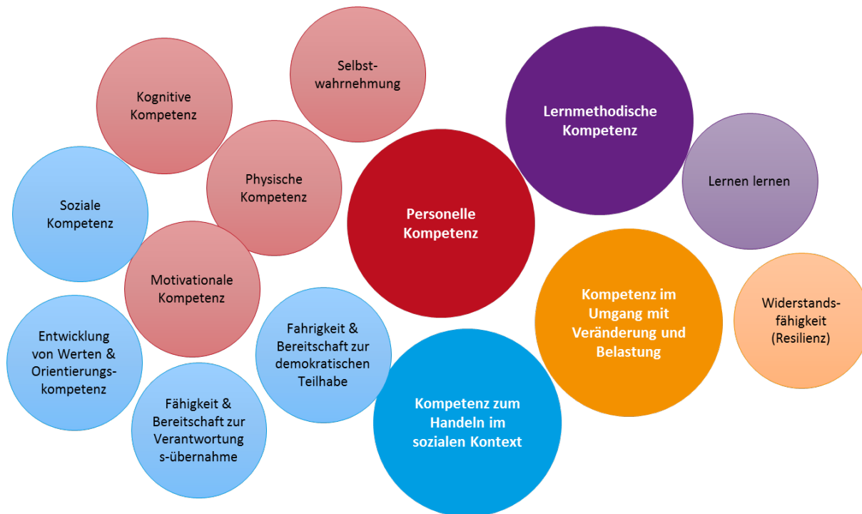
Abb. 2.2.-1: Basiskompetenzen nach dem BEP

Basiskompetenzen bilden das Fundament für nachhaltige und freudige Bildung. Ihnen zugrunde liegt die Annahme, dass jeder Mensch drei grundlegende Bedürfnisse hat: Er möchte sozial eingebunden sein und geliebt werden, eigene Entscheidungen treffen und etwas aus eigener Kraft können. Unsere Aufgabe ist es, die Kinder beim Erwerb dieser Kompetenzen zu unterstützen.