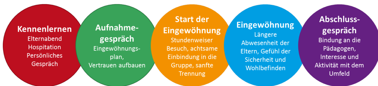
Abb. 5-1: Eingewöhnung in unsere Bambini Kinderkrippen

Vor der Eingewöhnung lernen wir uns in gemeinsamen Gesprächen, Elternabenden und Schnupperstunden kennen. Wir fragen die Familien aktiv nach wichtigen Informationen und Besonderheiten über die bisherige Entwicklung des Kindes und besprechen ihre Wünsche und Bedürfnisse. Darauf basierend gestalten wir gemeinsam den individuellen Eingewöhnungsverlauf und dokumentieren diesen.